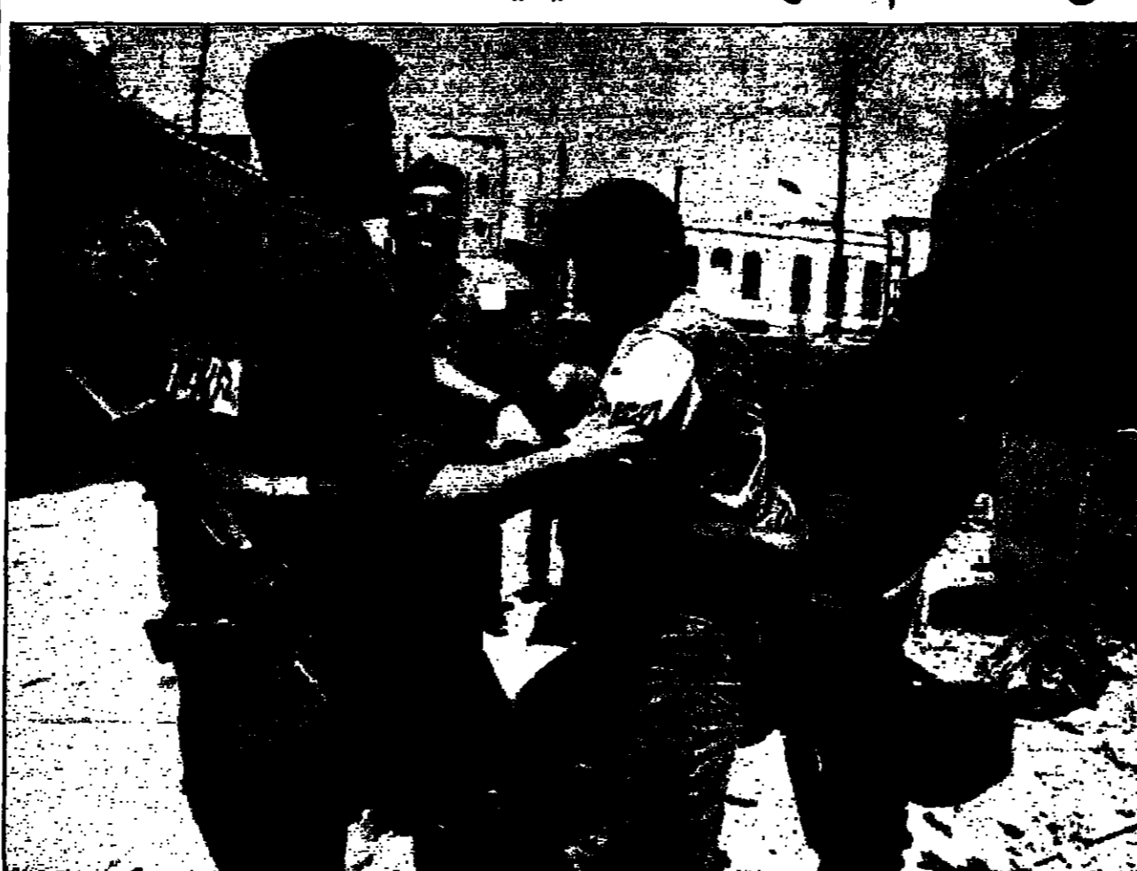
جند اسراييليين يعتقلون فلسطينيا في مدينة الخليل

التي وقعت في ايلول (سبتمبر) للضاحي بعد ان اقتحمت اسرائيل نفقا بالقرب من مزارات يهودا المسلمون في القدس. وقال الليكود (معاريف) في تصريحات نشرت الجمعة ان اثار الفلسطينيين معارفة مائة فلسطيني ورضا القوي بكثير واكثر ايلاما.